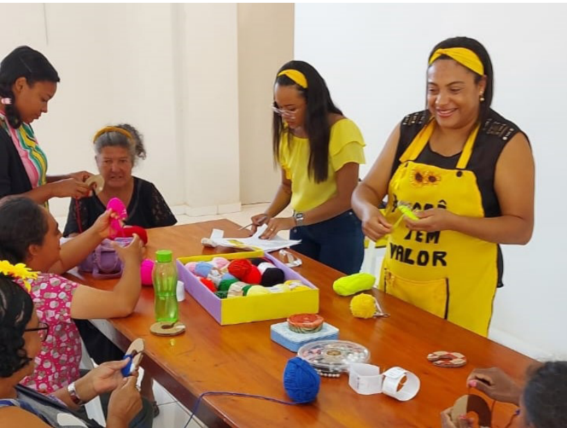
‘Caps Itinerante’ na Comunidade de Água Branca.

Na quarta-feira, dia 14, a ação foi realizada na Comunidade de Água Branca, na zona rural, com a realização, entre outras ações, de Oficinas Terapêuticas, avaliações com profissionais e Rodas de Conversa, além da distribuição de materiais informativos com orientações a população sobre a prevenção ao suicídio e exposição de trabalhos executados pelos usuários atendidos pela Unidade.