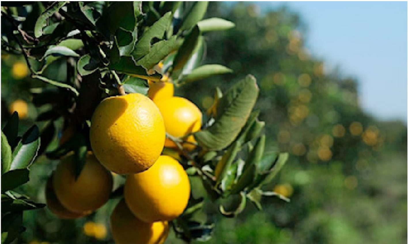
Método biotecnológico permite reciclar resíduos da laranja, transformando-os em um material de valor econômico agregado adequado a outros fins.

Um dos grandes desafios para a indústria de sucos é encontrar formas de reutilizar as cascas das frutas cítricas, que correspondem a mais de 40% do peso da matéria-prima usada na produção. Para solucionar essa questão, pesquisadores da Universidade Estadual de Campinas (Unicamp) desenvolveram um método biotecnológico que permite reciclar esses resíduos, transformando-os em um material de valor econômico agregado adequado a outros fins.