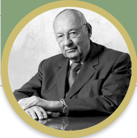
Presidente do Conselho Superior de Direito da Fecomercio-SP e professor emérito da Universidade Mackenzie, da Escola de Comando e Estado-Maior do Exército e da Escola Superior de Guerra